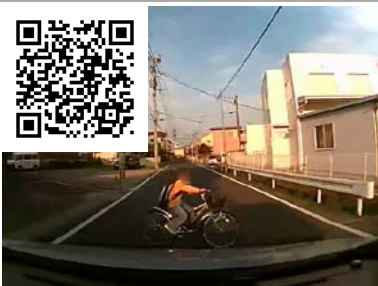
交通規則を知らない子供の自転車