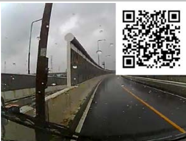
あぶなかったですー。