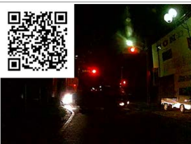
信号待ちで・・・