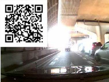
自車線が混んでくると車線変更したくなる！？