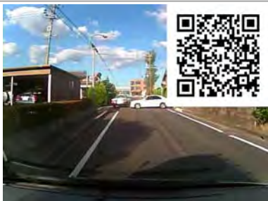
一旦停止をしていれば