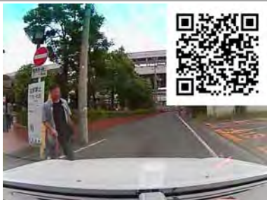
あわやサンキュー事故