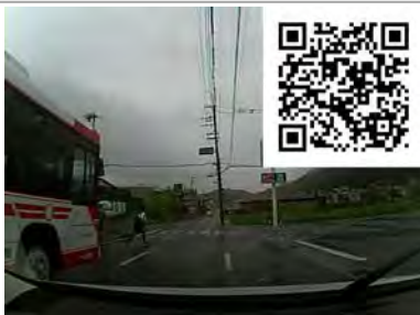
バスの陰から人が出てくるのも「出会い頭」のうち