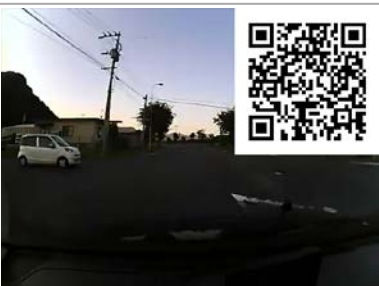
一旦停止無視！ 激突！