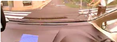
暴走自転車に遭遇も事故回避